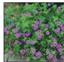
Árnyékliliom, tűzeső és gólyaorr