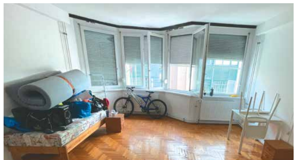
A fiatal pár a kerülettől egy frissen felújított lakóhelyet kapott a Peterdy utcai otthonban

Hazapakoltunk. Másnap azért még visszamentünk, mindenkitől el kellett köszönnünk. Eltelt pár nap és ismét beütött valami: egy kis honvágy a hely után, ahol több mint fél évig voltunk. És amikor szeretteinkkel húsvétkor az asztal körül ültünk, azok után, hogy boldogan elkészítettem életem első rizsfelfújtját, rájöttem, elfogyott a lekvár. De itthon vagyunk együtt Apánkkal. Készít még sokat. Készítsen is még sokat!